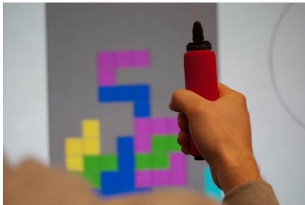
Abbildung 3: In Abstimmung auf das Krankheitsbild, kommen unterschiedliche Griffkomponenten zum Einsatz

Um eine Verwendung des Trainingsprogrammes auch für Menschen, die durch ihre körperliche Beeinträchtigung auf einen Rollstuhl angewiesen sind zu ermöglichen, wurde zusätzlich eine Option hinzugefügt, welche eine Überkopfverwendung des Motiontrackingsystems erlaubt.